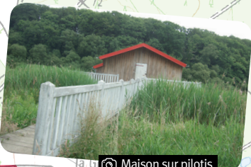
Maison sur pilotis