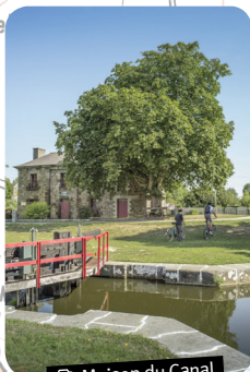
Maison du Canal