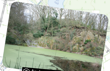
© Anciennes carrières de La Bouderie